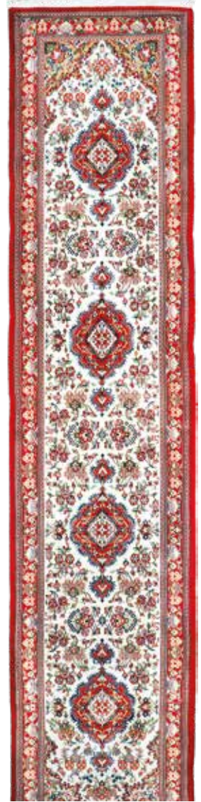
74 50 SP 1.750 € 640 € Ghom Kork fein, Persien, neuwertig, Korkwolle, ca. 371 x 80 cm