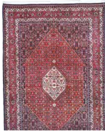
74 71 SP 2.200 € 890 € Bidjar Kork fein , Persien, neuwertig, Korkwolle, ca. 251 x 171 cm