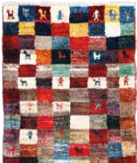
74 12 SP 450 € 155 € Gabbeh fein Loribaft , Persien, neuwertig, Wolle auf Wolle, ca. 85 x 60 cm