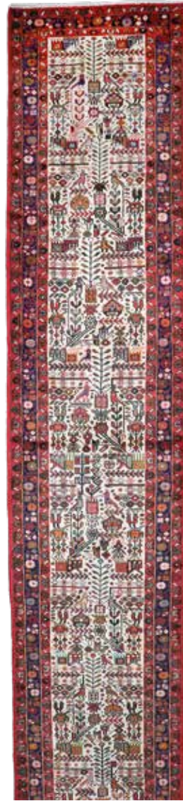
74 49 SP 990 € 290 € Assadabad, Persien, neuwertig, Wolle auf Baumwolle, ca. 396 x 82 cm