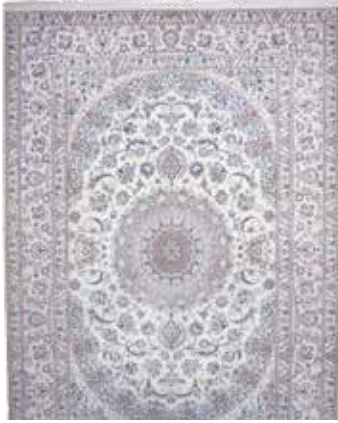
74 77 SP 9.900 € 4.900 € Nain fein Persien , signiert „Habibian“, neu, Korkwolle mit Seide, ca. 302 x 210 cm, ca. 800.000 Kn/qm