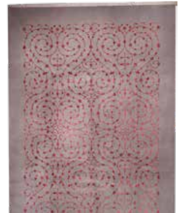
74 92 SP 3.900 € 1.450 € Nepal sehr fein , neu, Korkwolle mit Seide, ca. 295 x 203 cm