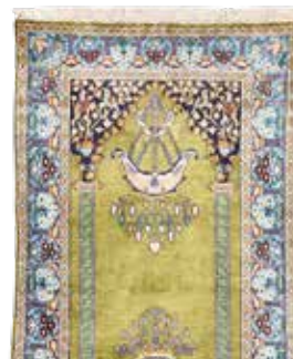
74 21 SP 690 € 195 € Kaschmir Seide , Indien, neuwertig, Seide auf Baumwolle, ca. 120 x 75 cm