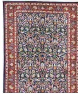
74 39 SP 1.850 € 590 € Sarogh Ghiasabad , Persien, neuwertig, Korkwolle, ca. 205 x 135 cm