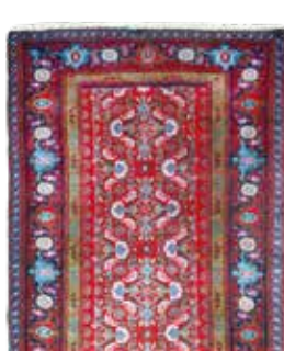
74 59 SP 1.150 € 390 € Senneh fein, Persien, neuwertig, Wolle auf Baumwolle, ca. 403 x 93 cm