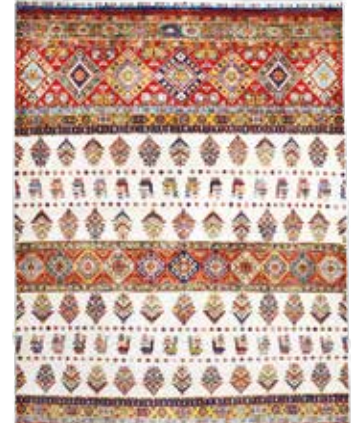
74 72 SP 2.800 € 1.450 € Sigler fein , neu, Wolle auf Baumwolle, ca. 256 x 169 cm