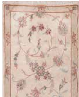
74 13 SP 490 € 165 € Täbriz , Persien, neuwertig, Wolle auf Baumwolle, ca. 130 x 79 cm