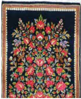
74 24 SP 490 € 165 € Kerman fein , Persien, neuwertig, Korkwolle, ca. 120 x 60 cm