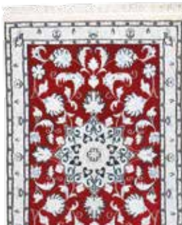
74 20 SP 185 € 95 € Nain fein , Persien, neuwertig, Korkwolle mit Seide, ca. 90 x 60 cm