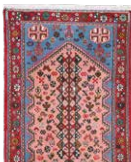
74 53 SP 690 € 195 € Abadeh, Persien, neuwertig, Wolle auf Baumwolle, ca. 194 x 70 cm