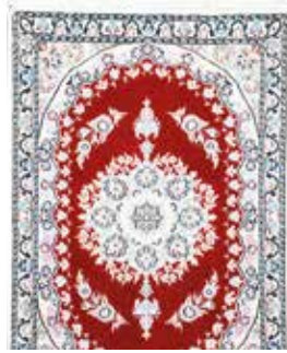
74 3 SP 450 € 145 € Nain fein , Persien, neuwertig, Wolle auf Baumwolle, ca. 87 x 59 cm