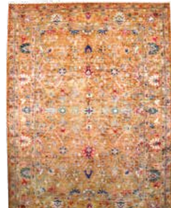
74 83 SP 6.900 € 3.550 € Sigler fein , neu, Wolle auf Baumwolle, ca. 374 x 281 cm