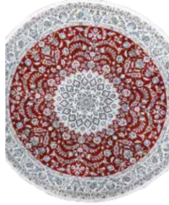
74 79 SP 4.900 € 2.500 € Nain fein , Persien, neu, Korkwolle mit Seide, durchmesser: ca. 250 cm, ca. 450.000 Kn/qm