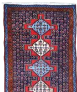
74 57 SP 1.150 € 390 € Senneh fein, Persien, neuwertig, Wolle auf Baumwolle, ca. 397 x 96 cm