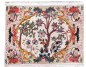
74 18 SP 450 € 145 € Täbriz fein , Persien, neuwertig, Korkwolle mit Seide, ca. 74 x 58 cm