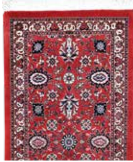
74 25 SP 890 € 290 € Bidjar fein , Persien, neuwertig, Korkwolle mit Seide, ca. 125 x 64 cm