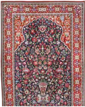
74 61 SP 1.450 € 590 € Ghom Kork fein , Persien, neuwertig, Korkwolle, ca. 210 x 143 cm