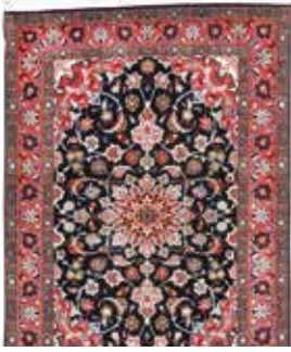
74 33 SP 1.250 € 390 € Täbriz fein , Persien, neuwertig, Korkwolle mit Seide, ca. 150 x 103 cm, ca. 500.000 Kn/qm