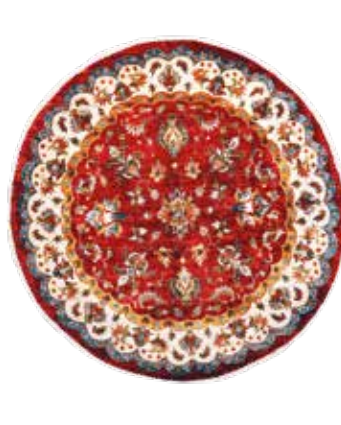
74 70 SP 1.950 € 1.050 € Sigler fein , neu, Wolle auf Baumwolle, durchmesser: ca. 174 cm