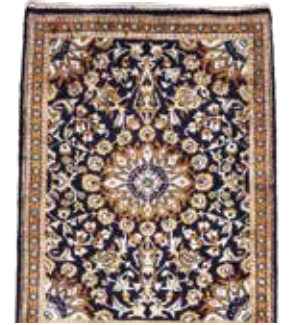
74 11 SP 590 € 195 € Ghom Seide , Persien, neuwertig, reine Naturseide, ca. 80 x 60 cm