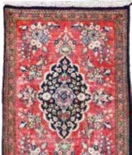
74 16 SP 590 € 195 € Ghom Seide , Persien, neuwertig, reine Naturseide, ca. 80 x 55 cm