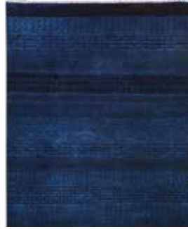
74 26 SP 790 € 290 € Gabbeh fein Loribaft , Indien, neu, Korkwolle, ca. 147 x 75 cm