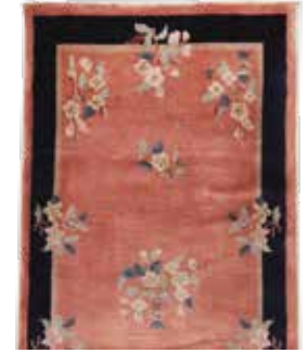
74 28 SP 580 € 165 € Peking , China, neuwertig, Wolle auf Baumwolle, ca. 138 x 69 cm