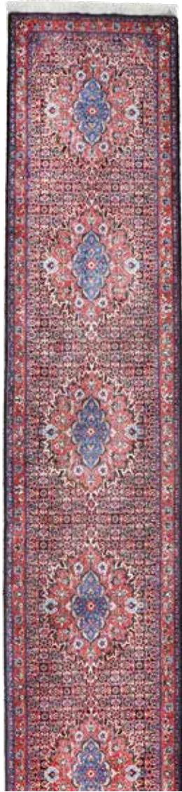
74 47 SP 2.200 € 790 € Bidjar Kork fein, Persien, neuwertig, Korkwolle mit Seide, ca. 390 x 66 cm