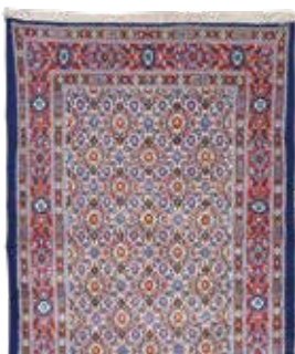
74 56 SP 590 € 185 € Mud fein, Persien, neuwertig, Wolle mit Seide, ca. 195 x 77 cm