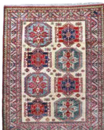
74 67 SP 2.900 € 1.100 € Kazak neu geknüpft , Pakistan, neuwertig, Wolle auf Wolle, ca. 260 x 210 cm