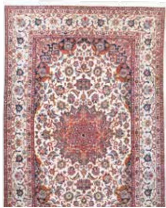
74 69 SP 5.900 € 1.950 € Esfahan fein , Persien, neuwertig, Korkwolle auf Seide, ca. 235 x 150 cm, ca. 1,0 Mio. Kn/qm