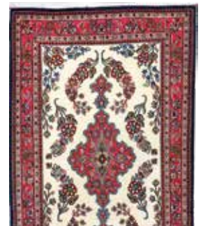
74 15 SP 590 € 175 € Ghom Kork , Persien, neuwertig, Korkwolle, ca. 130 x 78 cm