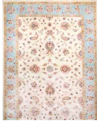
74 62 SP 3.900 € 2.100 € Sigler fein , neu, Wolle auf Baumwolle, ca. 298 x 204 cm