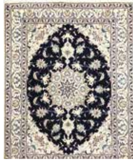
74 38 SP 1.150 € 590 € Nain , Persien, neu, Wolle auf Baumwolle, ca. 200 x 149 cm