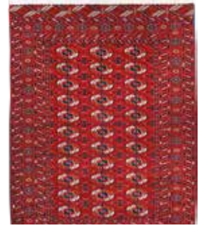
74 35 SP 1.250 € 390 € Buchara fein , Russland, neuwertig, Wolle auf Wolle, ca. 190 x 138 cm