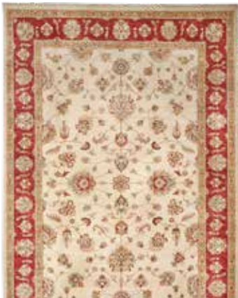
74 65 SP 3.800 € 1.790 € Sigler , neu, Wolle auf Baumwolle, ca. 298 x 202 cm