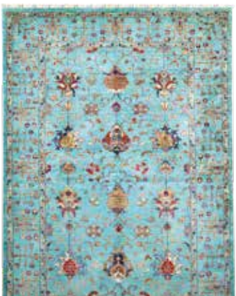
74 73 SP 2.900 € 1.490 € Sigler fein , neu, Wolle auf Baumwolle, ca. 249 x 177 cm