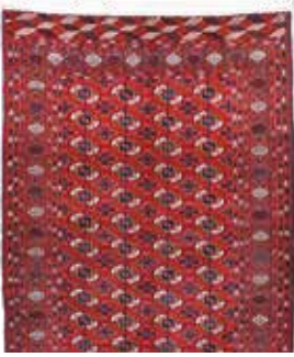
74 36 SP 1.450 € 490 € Buchara fein , Russland, neuwertig, Wolle auf Wolle, ca. 224 x 150 cm