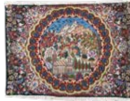
74 5 SP 390 € 95 € Kerman , Persien, neuwertig, Wolle auf Baumwolle, ca. 86 x 62 cm