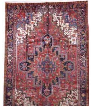
74 80 SP 2.900 € 1.150 € Heriz alt , Persien, ca. 50 Jahre, Wolle auf Baumwolle, ca. 316 x 210 cm