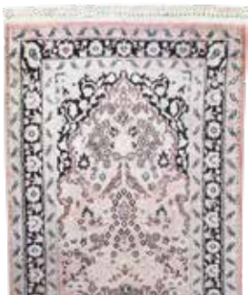
74 19 SP 390 € 120 € Kaschmir , Indien, neuwertig, merzerisierte Baumwolle, ca. 120 x 80 cm