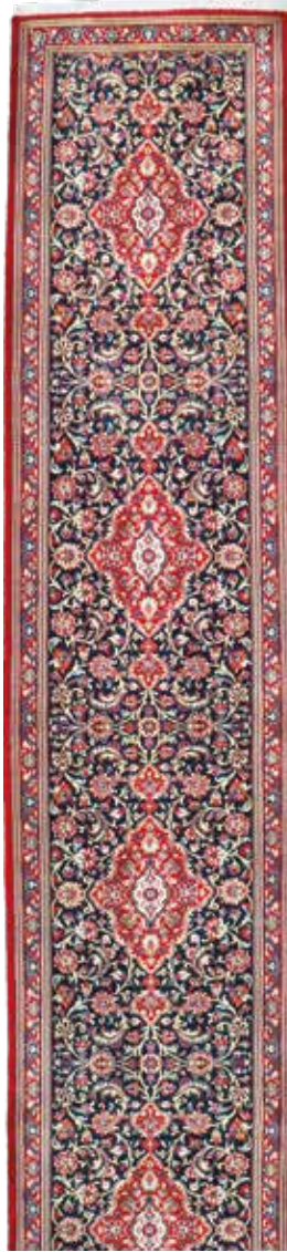
74 48 SP 1.950 € 690 € Ghom Kork fein, Persien, neuwertig, Korkwolle, ca. 395 x 80 cm