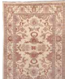
74 31 SP 890 € 290 € Sigler , neuwertig, Wolle auf Baumwolle, ca. 142 x 103 cm