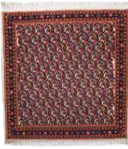
74 8 SP 450 € 145 € Sarogh fein , Persien, neuwertig, Korkwolle, ca. 78 x 74 cm