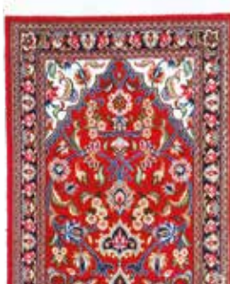
74 54 SP 590 € 165 € Ghom Kork, Persien, neuwertig, Korkwolle, ca. 153 x 55 cm