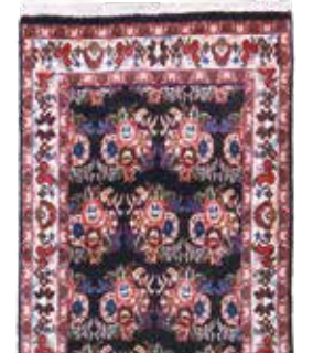
74 55 SP 550 € 195 € Bidjar fein, Persien, neuwertig, Korkwolle, ca. 160 x 60 cm