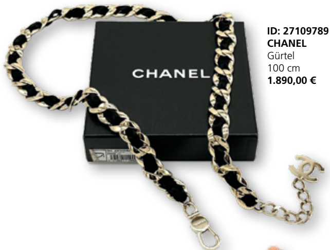
ID: 27109789 CHANEL Gürtel 100 cm 1.890,00 €