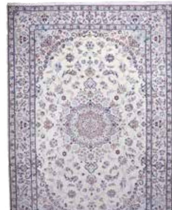
74 91 SP 4.900 € 2.500 € Nain fein , Persien, neu, Wolle auf Wolle, ca. 298 x 205 cm, ca. 450.000 Kn/qm