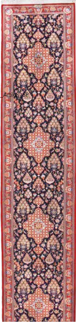
74 46 SP 1.950 € 690 € Ghom Kork fein, Persien, neuwertig, Korkwolle, ca. 394 x 80 cm