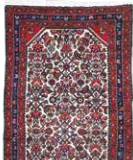
74 51 SP 490 € 185 € Assadabad, Persien, neuwertig, Wolle auf Baumwolle, ca. 197 x 78 cm