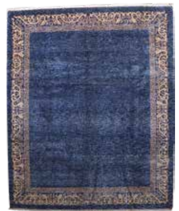
74 76 SP 5.900 € 1.650 € Azeri , Persien, neuwertig, Wolle auf Baumwolle, ca. 308 x 252 cm