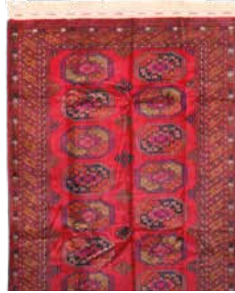
74 63 SP 2.200 € 690 € Buchara fein , Rußland, neuwertig, Wolle auf Wolle, ca. 247 x 170 cm