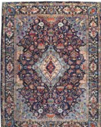
74 89 SP 2.900 € 1.150 € Kaschmar , Persien, neuwertig, Wolle auf Baumwolle, ca. 390 x 297 cm