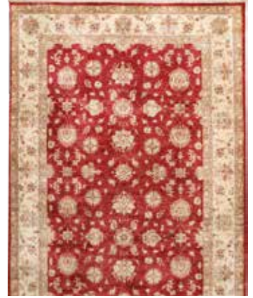
74 64 SP 3.900 € 1.880 € Sigler , neu, Wolle auf Baumwolle, ca. 297 x 210 cm