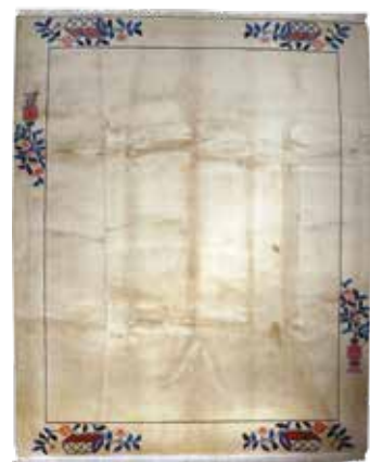
74 75 SP 3.900 € 1.100 € Peking , China, neuwertig, Wolle auf Baumwolle, ca. 305 x 248 cm