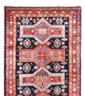
74 60 SP 690 € 250 € Meschgin, Persien, neuwertig, Wolle auf Baumwolle, ca. 300 x 100 cm