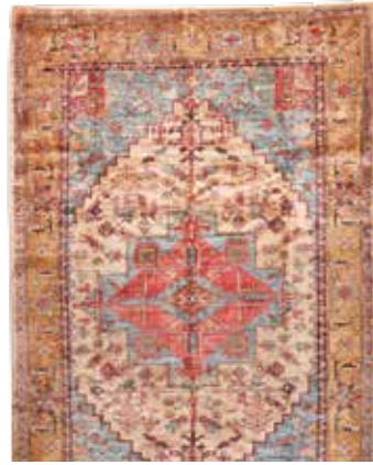
74 78 SP 5.900 € 1.550 € Azeri , Persien, neuwertig, Korkwolle, ca. 320 x 202 cm