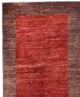
74 43 SP 1.150 € 390 € Sigler , neu, Wolle auf Baumwolle, ca. 200 x 126 cm