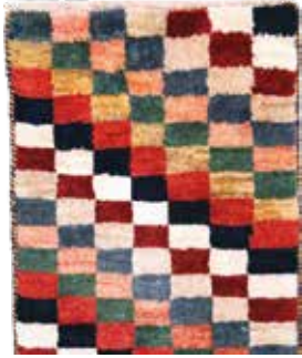
74 2 SP 290 € 95 € Gabbeh , Persien, neuwertig, Wolle auf Wolle, ca. 60 x 44 cm