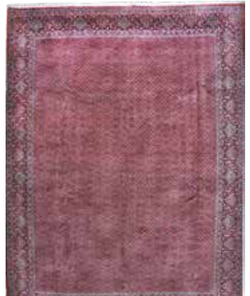
74 88 SP 9.900 € 3.900 € Bidjar Kork fein , Persien, neu, Korkwolle, ca. 410 x 308 cm