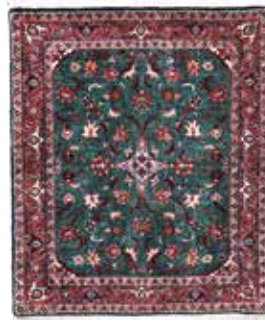
74 4 SP 590 € 195 € Bidjar fein , Persien, neuwertig, Korkwolle, ca. 85 x 72 cm