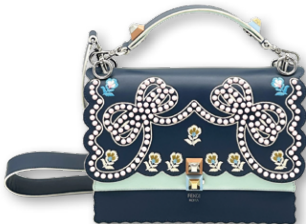
ID: 27114838 FENDI Kan Schultertasche B 25 x H 20 x T 10,5 cm 990,00 €