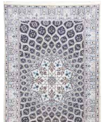
74 68 SP 5.500 € 2.500 € Nain fein , Persien, neu, Korkwolle mit Seide, ca. 224 x 146 cm, ca. 640.000 Kn/qm