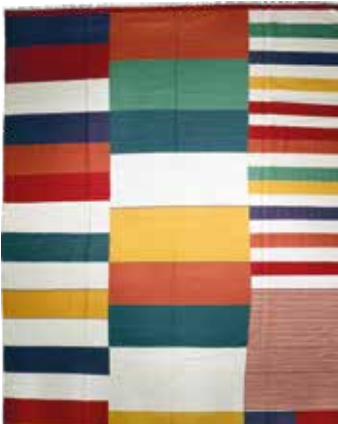
74 85 SP 3.500 € 1.450 € Ghaschgai Kelim , Persien, flachgewebt, neuwertig, Wolle auf Wolle, ca. 410 x 300 cm