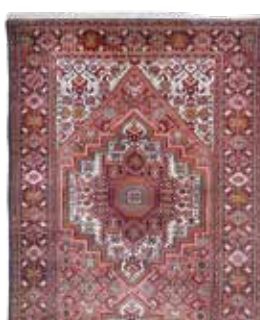
74 58 SP 1.250 € 390 € Gholtoogh fein, Persien, neuwertig, Wolle auf Baumwolle, ca. 400 x 93 cm