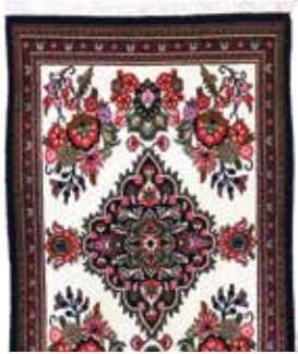
74 7 SP 450 € 145 € Ghom Kork , Persien, neuwertig, Korkwolle, ca. 97 x 60 cm