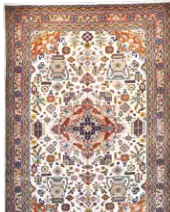
74 82 SP 2.900 € 1.350 € Ardebil fein (Seidengrund) , Persien, neu, Korkwolle mit Seide, ca. 295 x 196 cm