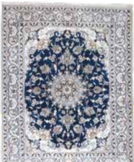
74 41 SP 1.150 € 590 € Nain , Persien, neu, Wolle auf Baumwolle, ca. 195 x 152 cm