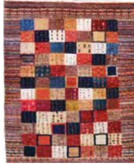
74 9 SP 590 € 195 € Gabbeh fein Loribaft , Persien, neuwertig, Wolle auf Wolle, ca. 106 x 85 cm