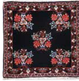
74 10 SP 450 € 150 € Bidjar fein , Persien, neuwertig, Korkwolle, ca. 70 x 70 cm