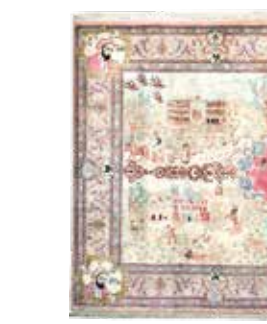
74 44 SP 8.900 € 2.900 € Ghom Seide fein Persien , „Vier Jahreszeiten“ signiert „Scharifi“, neu, reine Naturseide, ca. 150 x 102 cm, ca. 1,0 Mio. Kn/qm