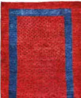
74 17 SP 690 € 250 € Gabbeh fein Loribaft , Persien, neuwertig, Wolle auf Wolle, ca. 130 x 90 cm