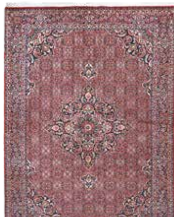
74 66 SP 2.800 € 990 € Bidjar fein , Persien, neu, Korkwolle mit Seide, ca. 240 x 174 cm