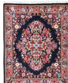
74 22 SP 450 € 145 € Sarogh fein , Persien, neuwertig, Korkwolle, ca. 94 x 76 cm