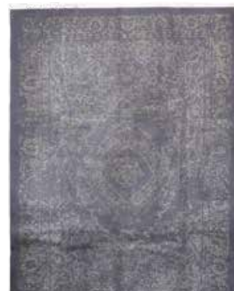
74 90 SP 4.900 € 1.450 € Nepal sehr fein , neu, Korkwolle mit Seide, ca. 290 x 202 cm