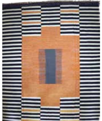
74 84 SP 2.900 € 1.190 € Ghaschgai Kelim Persien , flachgewebt, neuwertig, Wolle auf Wolle, ca. 365 x 273 cm