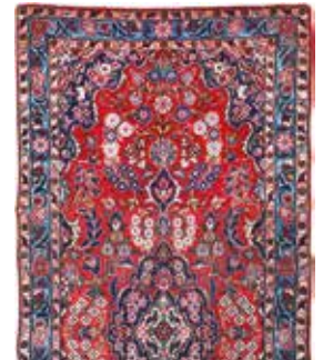
74 23 SP 590 € 175 € Keschan alt , Persien, ca. 50 Jahre, Wolle auf Baumwolle, ca. 135 x 60 cm