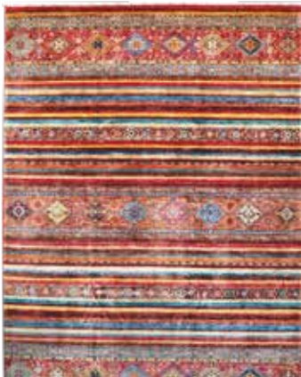
74 81 SP 5.900 € 3.050 € Sigler fein , neu, Wolle auf Baumwolle, ca. 350 x 256 cm