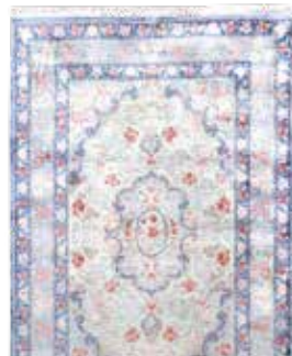
74 42 SP 6.900 € 1.950 € Ghom Seide signiert , Persien, neuwertig, reine Naturseide, ca. 150 x 100 cm, ca. 1,0 Mio. Kn/qm