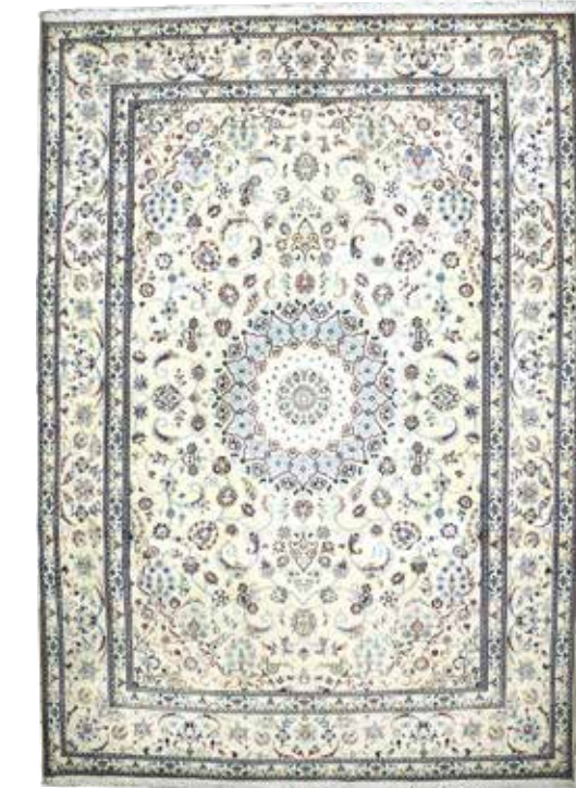
74 30 SP 6.900 € 3.500 € Nain fein , Persien, neu, Korkwolle mit Seide, ca. 355 x 249 cm, ca. 450.000 Kn/qm