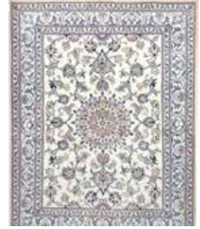
74 40 SP 1.150 € 590 € Nain , Persien, neu, Wolle auf Baumwolle, ca. 197 x 152 cm