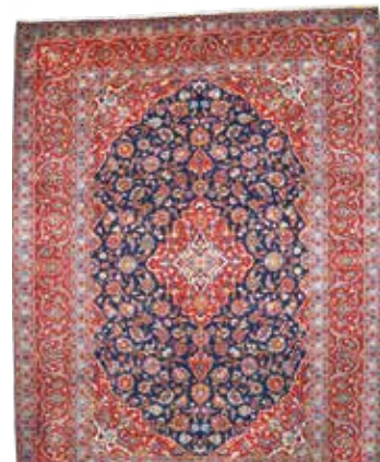
74 91 SP 2.200 € 1.100 € Keschan , Persien, neuwertig, Wolle auf Baumwolle, ca. 400 x 290 cm