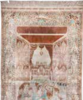
74 29 SP 2.400 € 590 € Hereke Seide fein , China, neuwertig, reine Naturseide, ca. 158 x 93 cm, ca. 1,0 Mio. Kn/qm