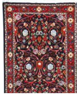
74 27 SP 590 € 185 € Sarogh fein , Persien, neuwertig, Korkwolle, ca. 130 x 65 cm