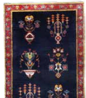
74 32 SP 650 € 250 € Gabbeh fein Loribaft , Persien, neuwertig, Korkwolle, ca. 140 x 70 cm