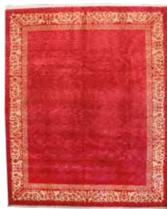
74 74 SP 5.900 € 1.650 € Azeri , Persien, neuwertig, Wolle auf Baumwolle, ca. 308 x 252 cm