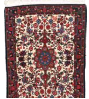
74 6 SP 450 € 145 € Rosenbidjar , Persien, neuwertig, Wolle auf Baumwolle, ca. 100 x 72 cm