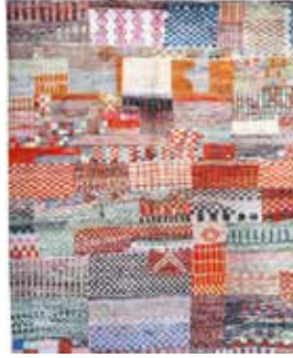
74 37 SP 3.300 € 1.100 € Gabbeh „Modern“ , Persien, neuwertig, Wolle auf Wolle, ca. 227 x 157 cm