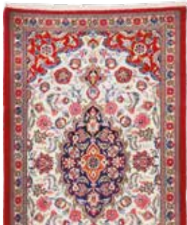
74 52 SP 890 € 290 € Ghom Kork, Persien, neuwertig, Korkwolle, ca. 233 x 78 cm