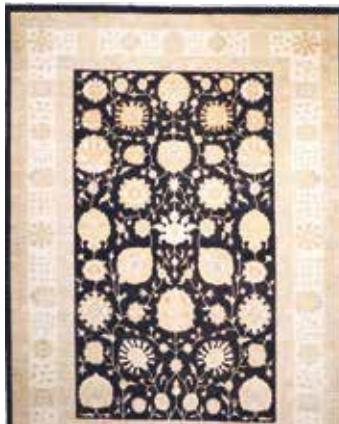
74 86 SP 6.500 € 3.350 € Sigler fein , neu, Wolle auf Baumwolle, ca. 376 x 268 cm