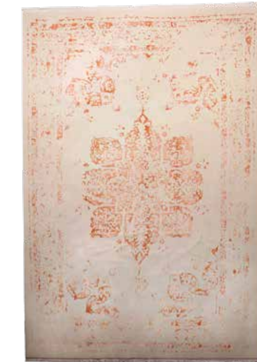
74 14 SP 4.900 € 1.450 € Nepal sehr fein , neu, Korkwolle mit Seide, ca. 297 x 202 cm